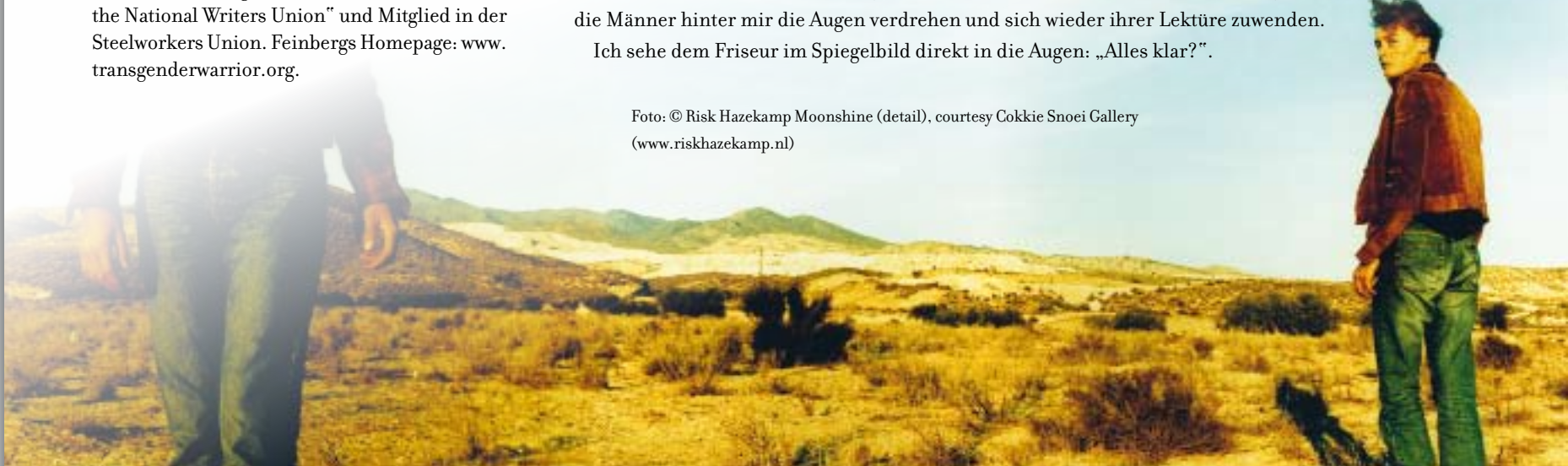
Moonshine (detail)

Ich sehe dem Friseur im Spiegelbild direkt in die Augen: „Alles klar?“