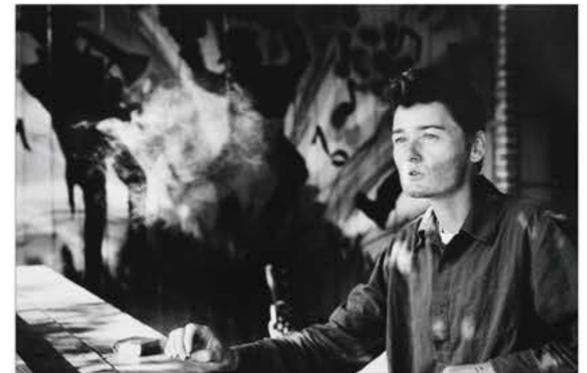
linke Seite: Hattiesburg diese Seite: oben: Biloxi links unten: Cemetery (Friedhof) rechts unten: Jazz Club